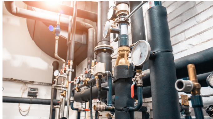
Heizungs- und Sanitärtechnik