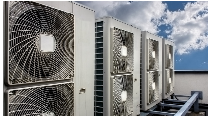
Klima- und Kältetechnik